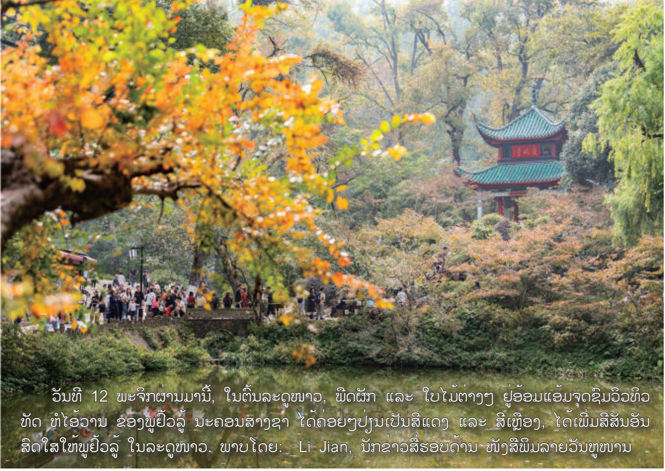
ວັນທີ 12 ພະຈິກຜ່ານມານີ້, ໃນຕົ້ນລະດູໜາວ, ພືດຜັກ ແລະ ໃບໄມ້ຕ່າງໆ ຢູ່ອ້ອມແອ້ມຈຸດຊົມວິວທິວທັດ ທໍ່ໂອວານ ຂອງພູຍິ້ວລູ ນະຄອນສາງຂາ ໄດ້ຄ່ອຍໆປ່ຽນເປັນສີແດງ ແລະ ສີເຫຼືອງ, ໄດ້ເພິ່ມສີສັນອັນລົດໃສໃຫ້ພູຍິ້ວລູ ໃນລະດູໜາວ.